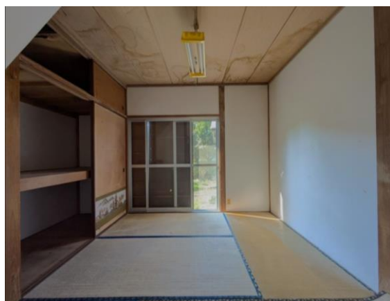
1F 和室 4.5帖