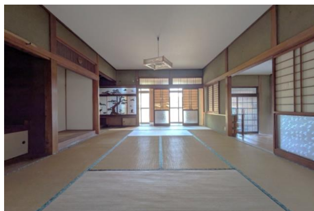
1F 和室 10帖