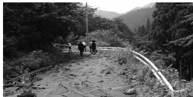
■県道多良岳公園線（中山キャンプ場へ上る道路）