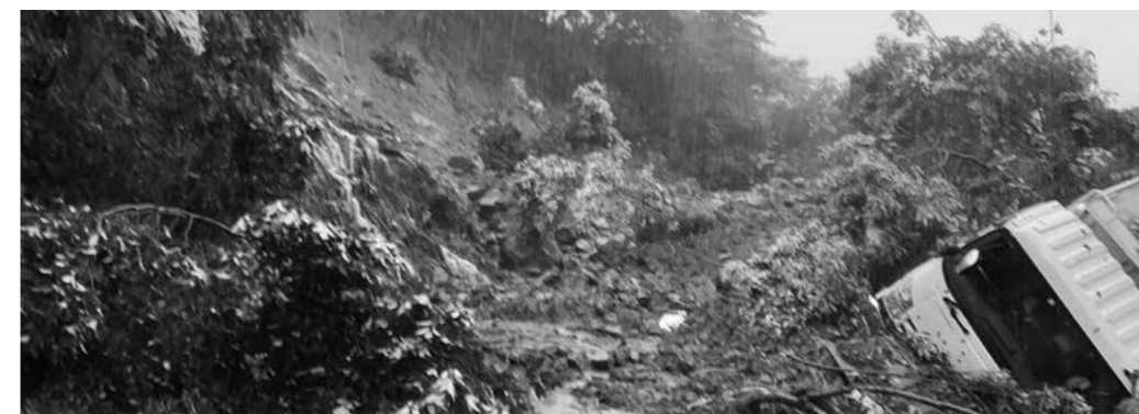
オレンジ海道（長川原～御手水間）

議員 今回の豪雨では、多良川、糸岐川、伊福川に設置している水位計のデータは、どのように活かされたのか。