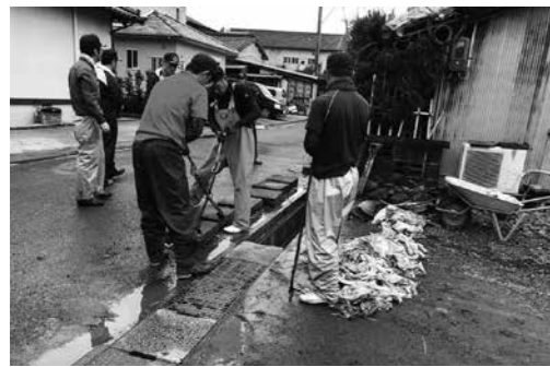
消防団による災害対応

議員 避難所の状況などを 議員 災害時の情報発信を個人のスマートフォンへ直接行えないか。 総務課長 戸別受信機を全戸配布する予定だが、他のツールも組み合わせることで情報の周知に務める。 議員 観光のこういった部分に対して、経済活性化の可能性を見出しているのか。 企画商工課長 域外からの外貨獲得が可能なら、GOTOトラベルの状況も見ながら活性化を図りたい。 議員 都市部から地方へのオフィス移転やリモートワーク希望者が増えている事への対応は、 企画商工課長 本町にお