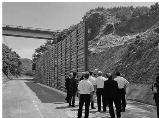
■オレンジ海道（長川原～御手水間）