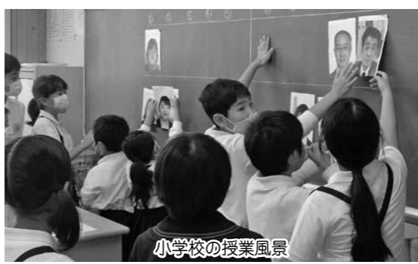
小学校の授業風景