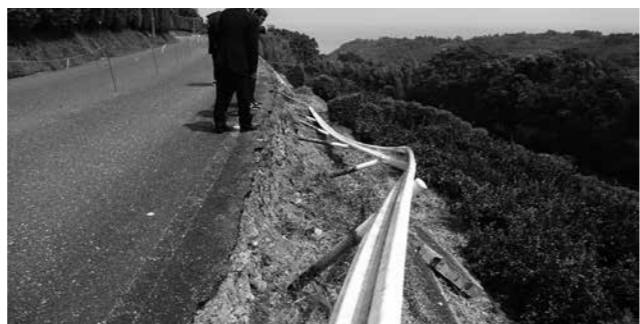
■町道嘉瀬ノ坂～日当線