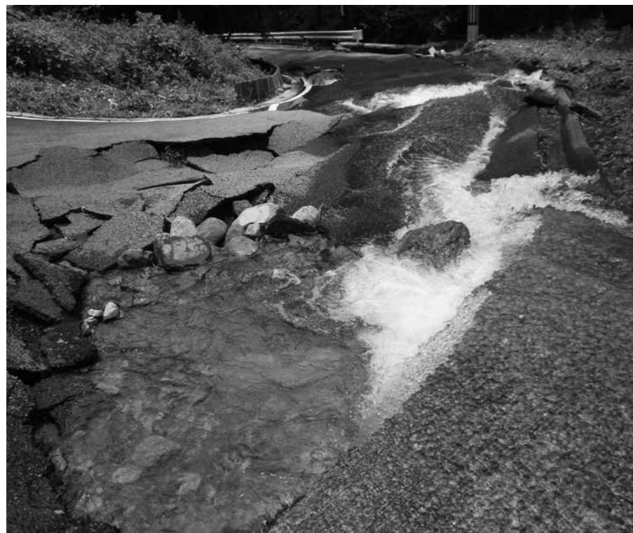
中山キャンプ場下の県道

議員 今回の災害では、さらに警戒レベルが上昇し、避難勧告を発令と同時に避難所の増設を行った。