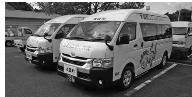
試験運行が始まったコミュニティバス

大人200円。小学生以下と65歳以上は100円。年内3か月間は無料になる。 議員 試験運行の目的は何か。 企画商工課長 来年4月1日からの本格運行に向けての事前周知と、課題や問題点を整理し改善すること。 議員 本格運行とどこが違うのか。 企画商工課長 運行路線、本数、時間は同じだが、年内は運賃が無料。 議員 事業予算はどのくらいになるか。 企画商工課長 本年度は半年間で約1300万円。来年度は約2300万円を見込んでいる。 議員 運営主体はどこになるか。 企画商工課長 (有)再耕庵タクシーに業務委託する予定だ。 議員 町の直営でなく委託するメリットは、 企画商工課長 運行の効率化や安全面に対するノウハウを活用できること。また、試算でも委託のほうが若干安くなった。 議員 現在、社会福祉協議会で運行されている福祉バスはどうなるのか。 町民福祉課長 9月いっぱいまで廃止となるが、福祉バスは無料だったため、しおさい館利用料とコミュニティバスの運賃については調整検討中である。 議員 多良地区に行政機関などが集中して大浦地区住民は移動の負担が大きい。以前、高齢者に対し路線バスの無料パスなどの配布を検討してもらいたいと質問したが、