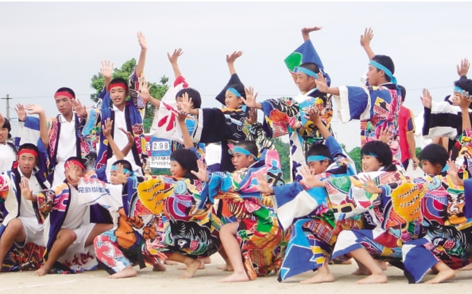
大浦中学校運動会