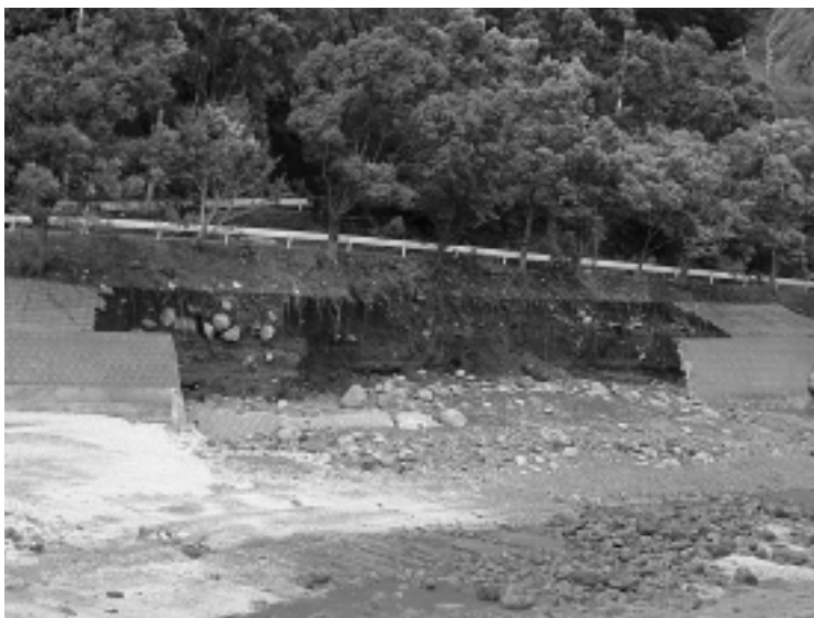
波瀬ノ浦道路災害

流失、竹崎漁業集落排水処理場の護岸は平成十六年九月八日台風十八号でも同じく被害を受けており、今後の災害復旧として国、県に消波ブロックの設置の対策要請が望まれる。