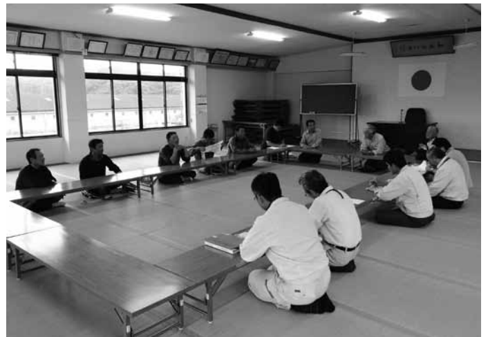
▲漁業関係者との意見交換会