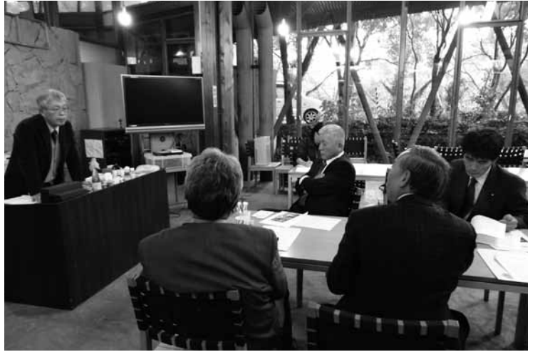
▲「内子フレッシュパークからり」にて

地元特産品の特徴を活かし、消費者ニーズに合った商品開発と販路の拡大が重要だと改めて気付かされる視察でした。