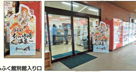
たらふく館別館入り口

道の駅太良で開催されるイベントに友だちと一緒に遊びに行っただけです。販売しているみかんの種類にびっくりしました。