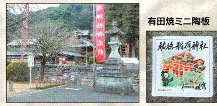
有田焼ミニ陶板 祐徳稲荷神社