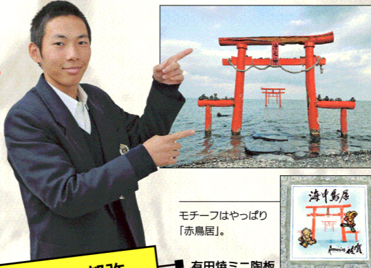
モチーフはやっぱり「赤鳥居」。

海の中に赤い鳥居があって、映えスポットとして観光客の方も多く訪れているスポットです。学校から歩いて10分くらいのところにあり、校舎の3階からも鳥居が見えるんです。干満の差で鳥居の景色が変わるのも魅力ですが、日の出の時間帯の景色も意外と有名ですよ。