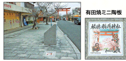
有田焼ミニ陶板 祐徳稲荷神社