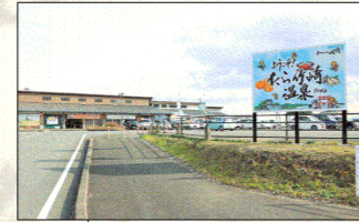
車道からでも視界に入る場所に設置された案内板には、竹崎かみや海中鳥居など、太良のおすすめスポットが描かれています。

道の駅太良は国道207号沿いにあり、大型車が駐車できるスペースも確保されています。敷地内にある展望台からは有明海の干潟や雲仙まで見渡すことができます。トイレや休憩に立ち寄るにはピッタリ! ついでに直売所のたらふく館や観光案内所を覗いてみてくださいね。