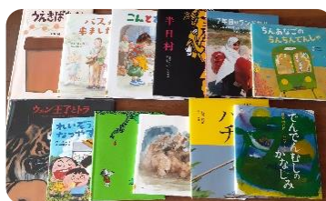
昭和39年大浦小学校 1年1組有志一同

大浦小卒業生の有志の方から 絵本を寄付 していただきました。校長室の読み聞かせ用本棚に入っていて、活用させていただいています。